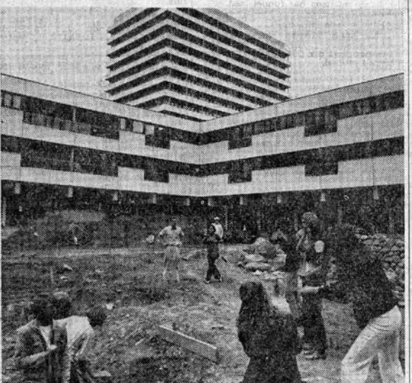
Den unge kunstnergruppe graver ud til søen, der får andeø og bro. I baggrunden ses Peder Lykke Centrets kollektivhus.

- Et kunstværk - ja - men anlæg men en levende have, de ældre har lov at bygge videre på, understreger direktør Theisler,